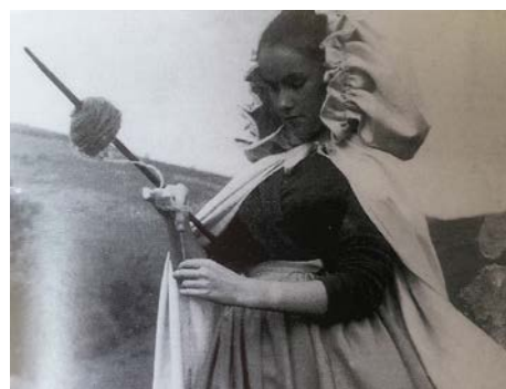
1957, La Dame bleue de Freysselines (court métrage sur une légende limousine)

(sources : Courts métrages en Limousin – catalogue 1996 / Centre Culturel de Brive-la-Gaillarde )