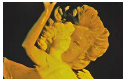
La danseuse (Film 3 fois primé)

Films expérimentaux : Moutier d'Ahun (1974), Sainte-Barbe (1980), La danseuse (1988), Valse (1993)