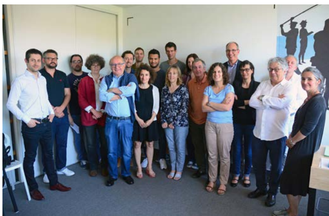
Partenaires du réseau Mémoire Filmique

Le Fonds Audiovisuel de Recherche (FAR - La Rochelle), La Mémoire de Bordeaux Métropole, Trafic image (Angoulême) ont signé au siège de La Cinémathèque de Nouvelle-Aquitaine (CdNA) à Limoges la convention de partenariat officialisant la naissance du réseau MÉMOIRE FILMIQUE DE NOUVELLE-AQUITAINE , en présence du Directeur du patrimoine cinématographique du Centre National de la Cinématographie (CNC), des représentants des services culturels de la Région Nouvelle-Aquitaine et de la DRAC de Nouvelle-Aquitaine.